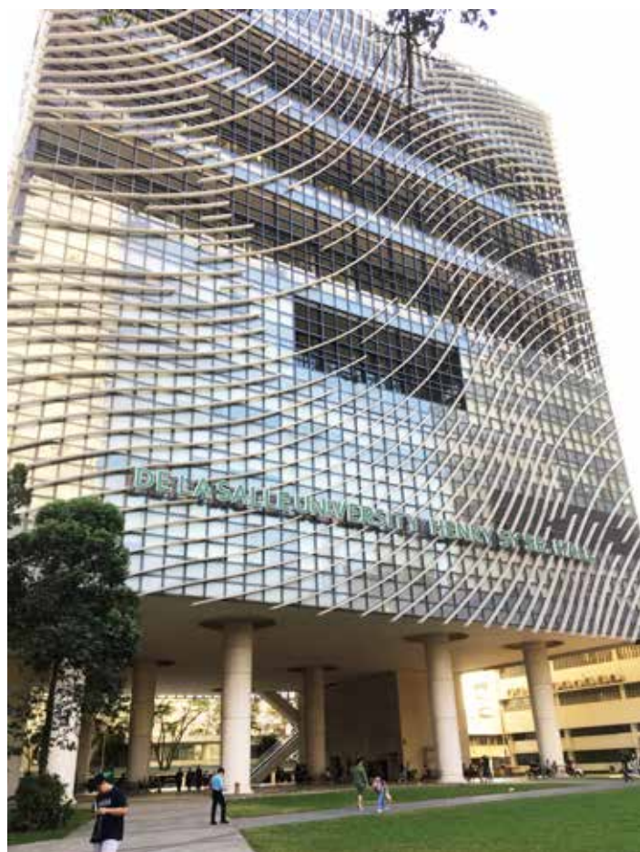
デ・ラ・サール大学校舎

奨学金がつくか付くか付かないかは、年度開始までわかりません。奨学金が付いた場合、受給資格者は日本人または永住資格者となります。授業料は大阪大学に払うこととなりますが、デ・ラ・サール大学では授業料以外にビザ切替等に経費が発生します。また、渡航費、海外旅行保険が必要となります。